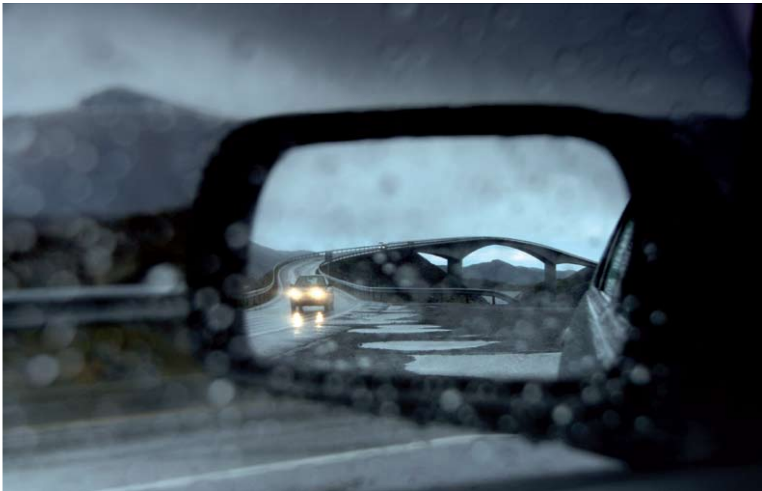
"Mot stormen" av Vladimir Kovalenko, Molde Kameraklubb