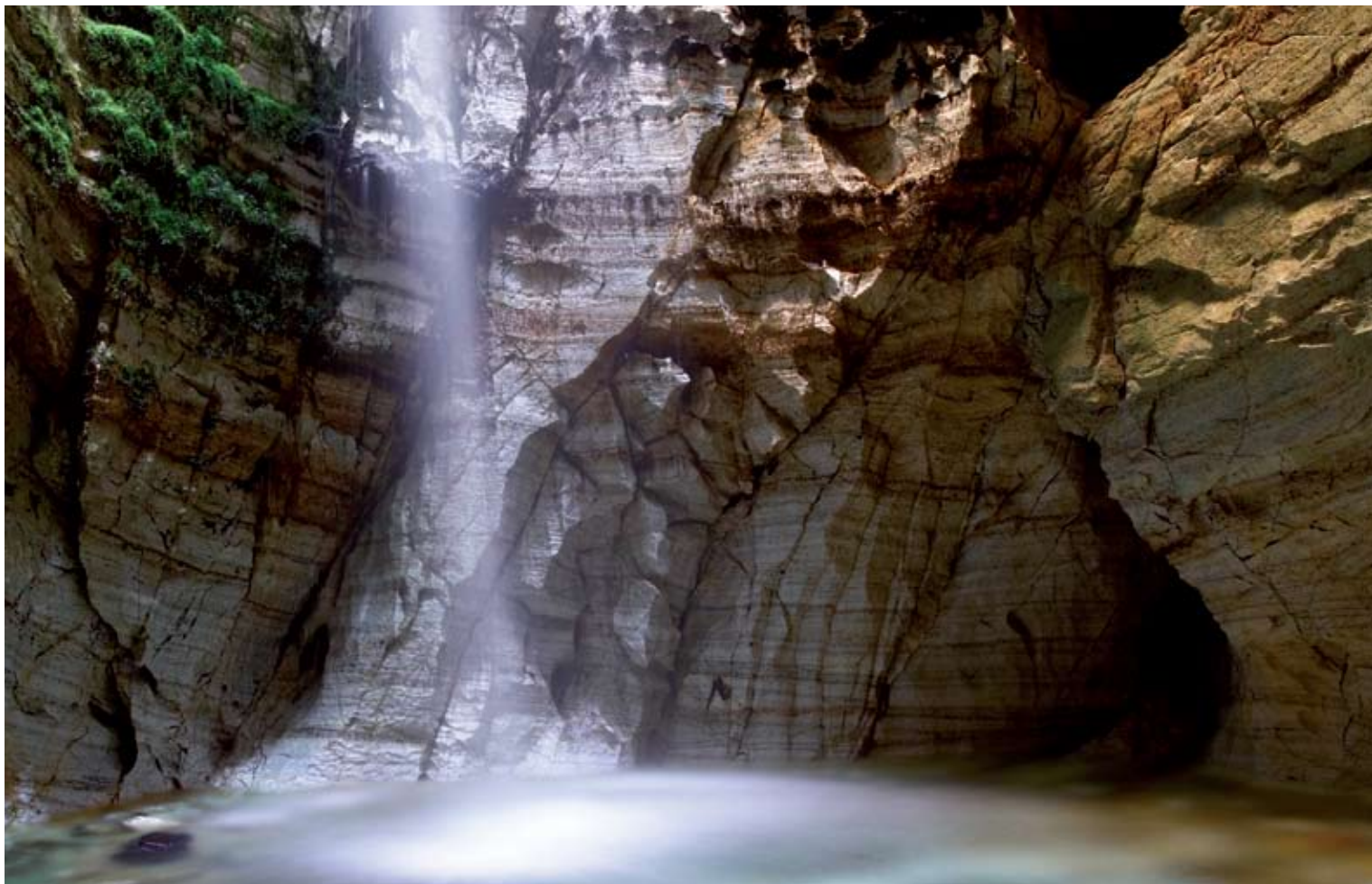
"Trollkirka" av Michal Kaut, Molde Kameraklubb