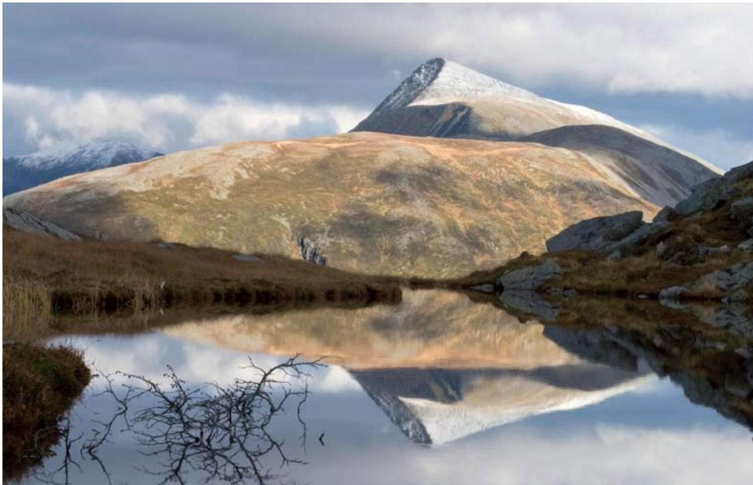
"Urdfjellet" Tatt fra Rossholtjønna