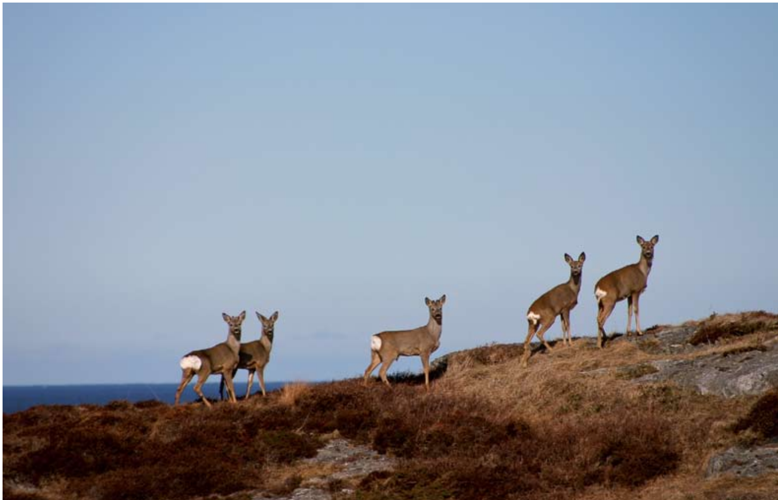
"Øyboere" Tatt på Smørholmen, Vevang