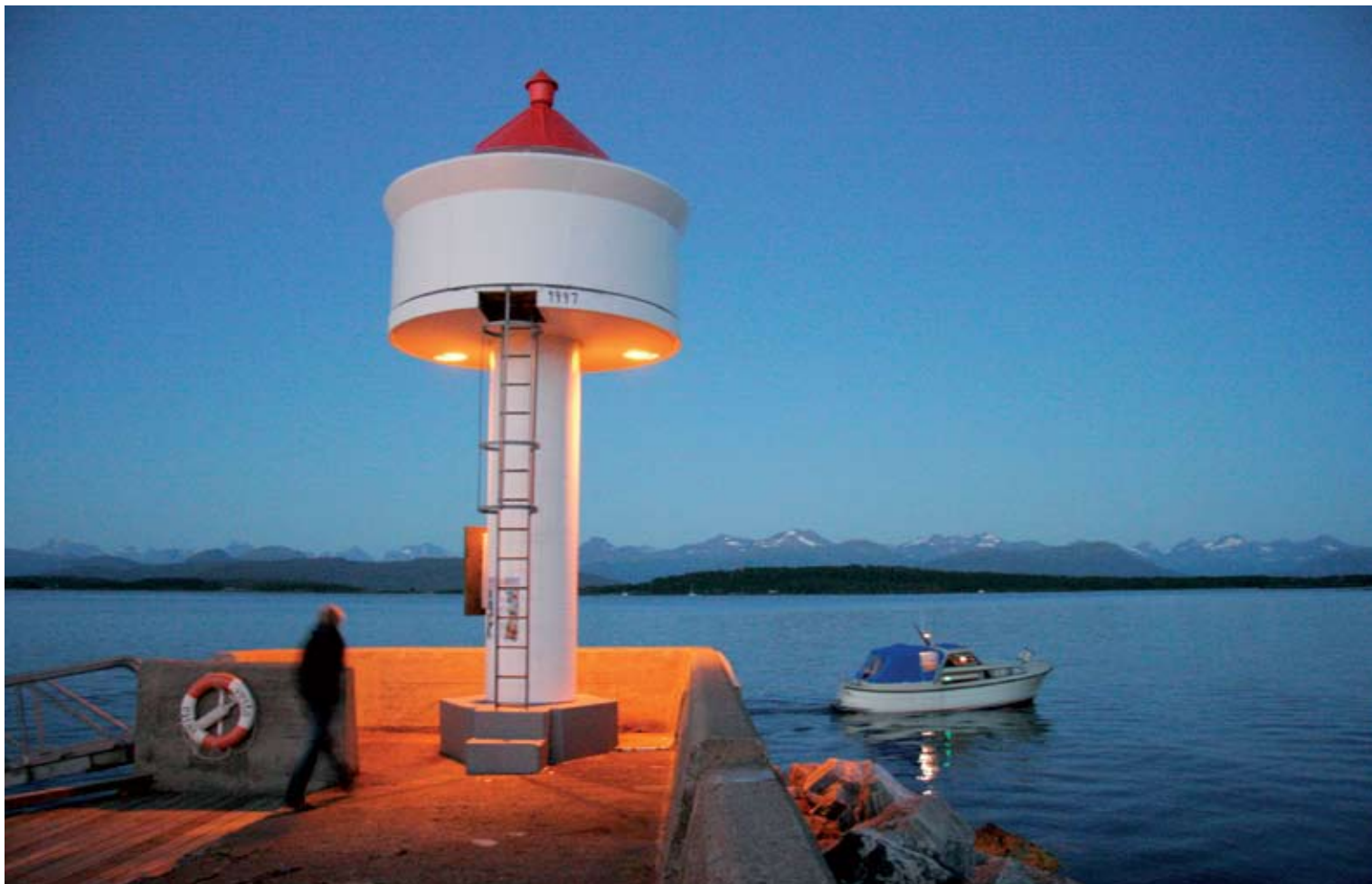
"Skumring ved Reknes fyr" av Bjarne Nygård, Molde Kameraklubb