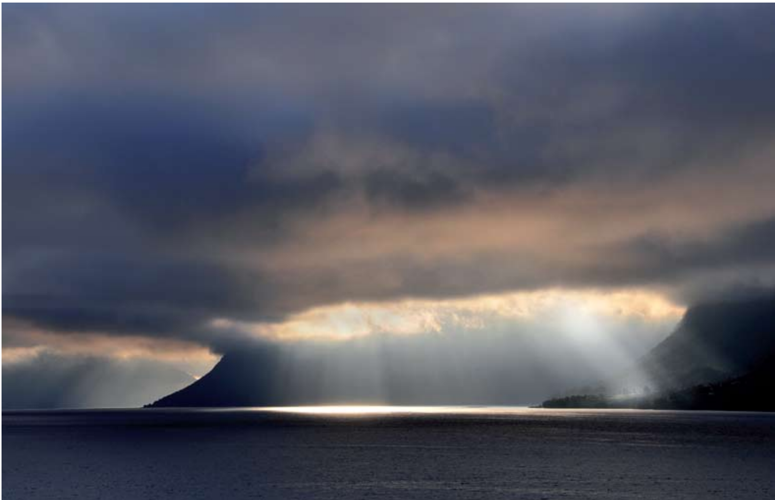
"Lysspill over Langfjorden, Nesset" av Leiv Erling Aasan, Molde Kameraklubb