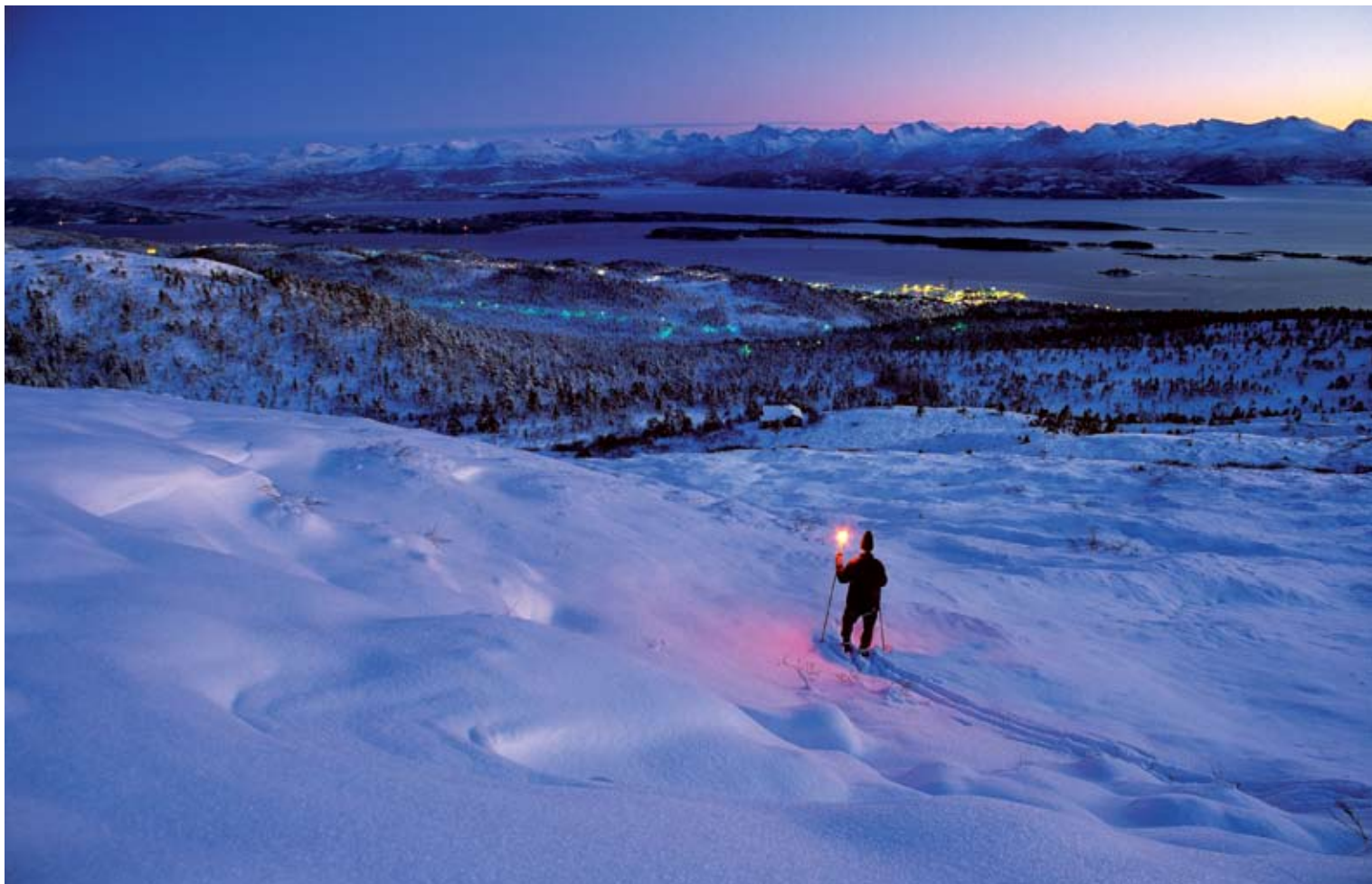
"Vintereventyr" av Bjarne Nygård, Molde Kameraklubb