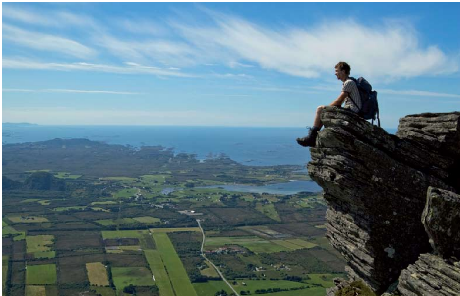
"Sjurvarden" av Svein Kvakland, Molde Kameraklubb