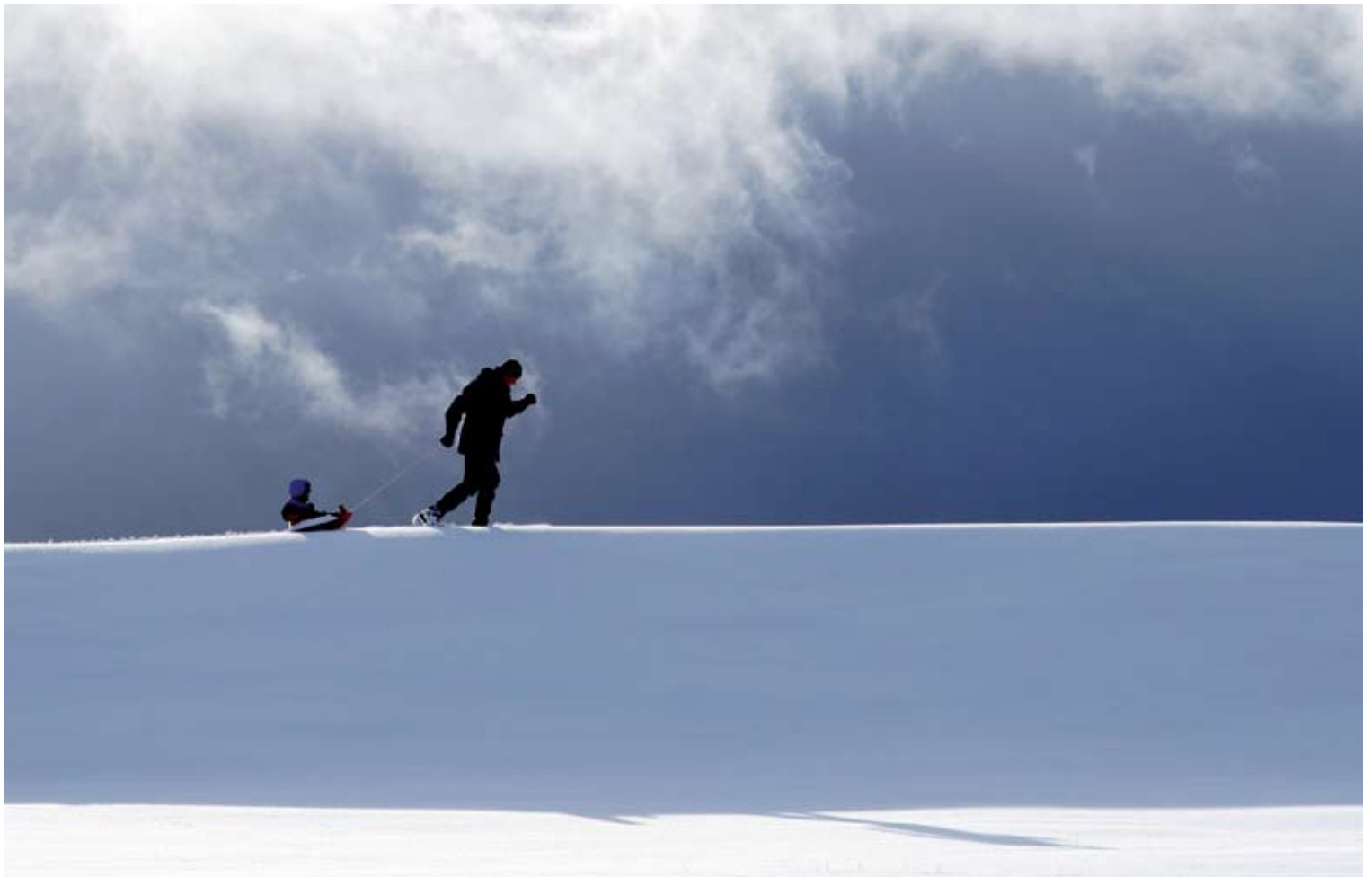
"Ut på tur" Tatt på Retiro av Bjarne Nygård, Molde Kameraklubb