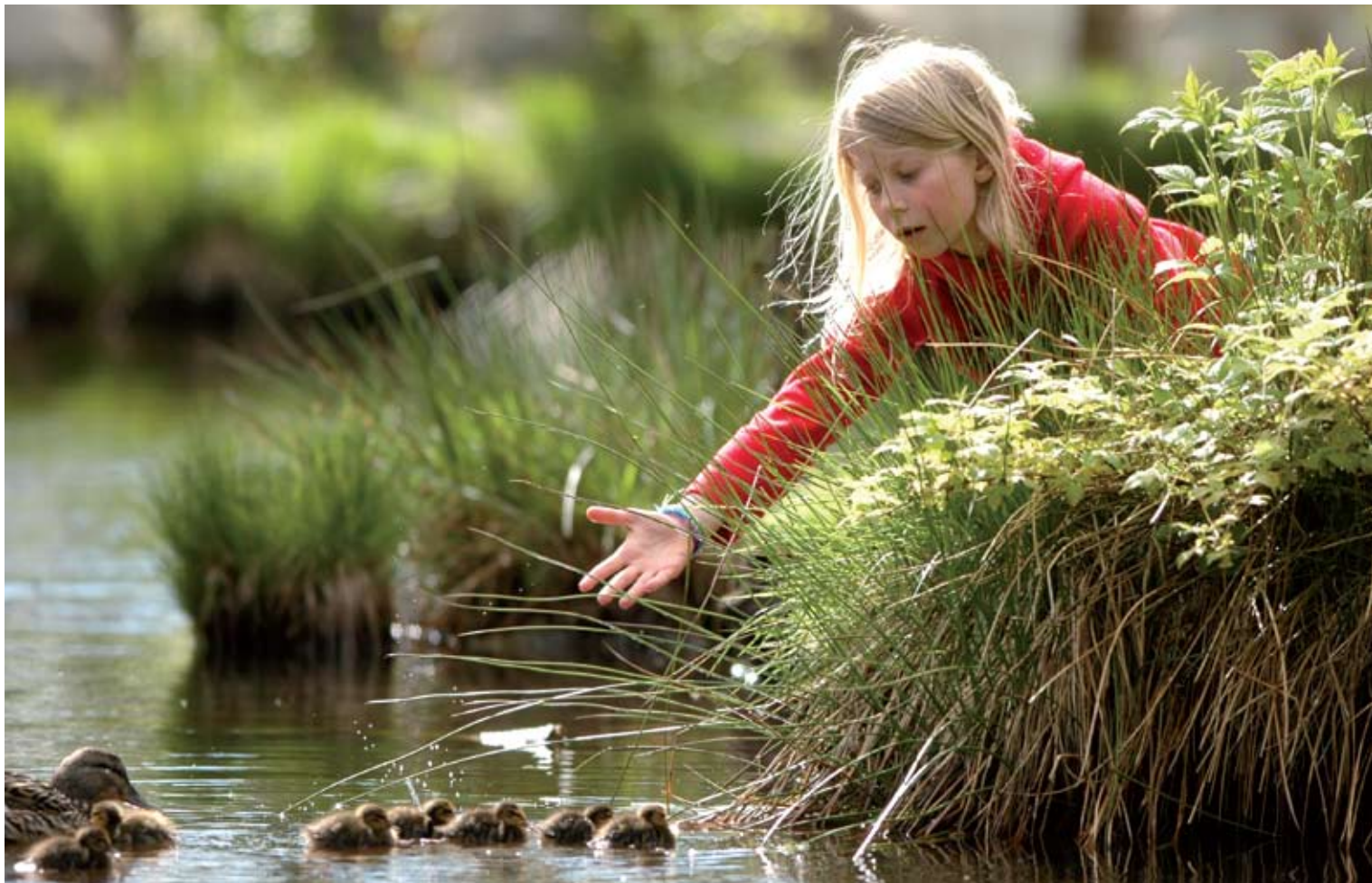
"Sommeridyll" Tatt på Romsdalsmuseet av Bjarne Nygård, Molde Kameraklubb