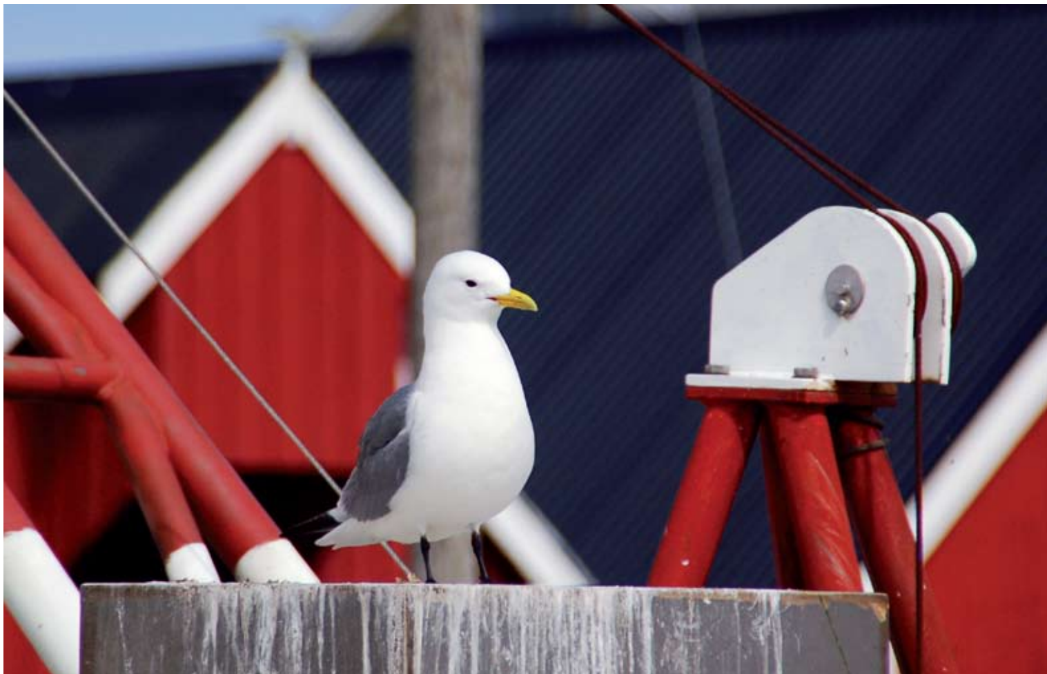
"Maimåse" Tatt på Bud av Marit Sprosheim, Molde Kameraklubb