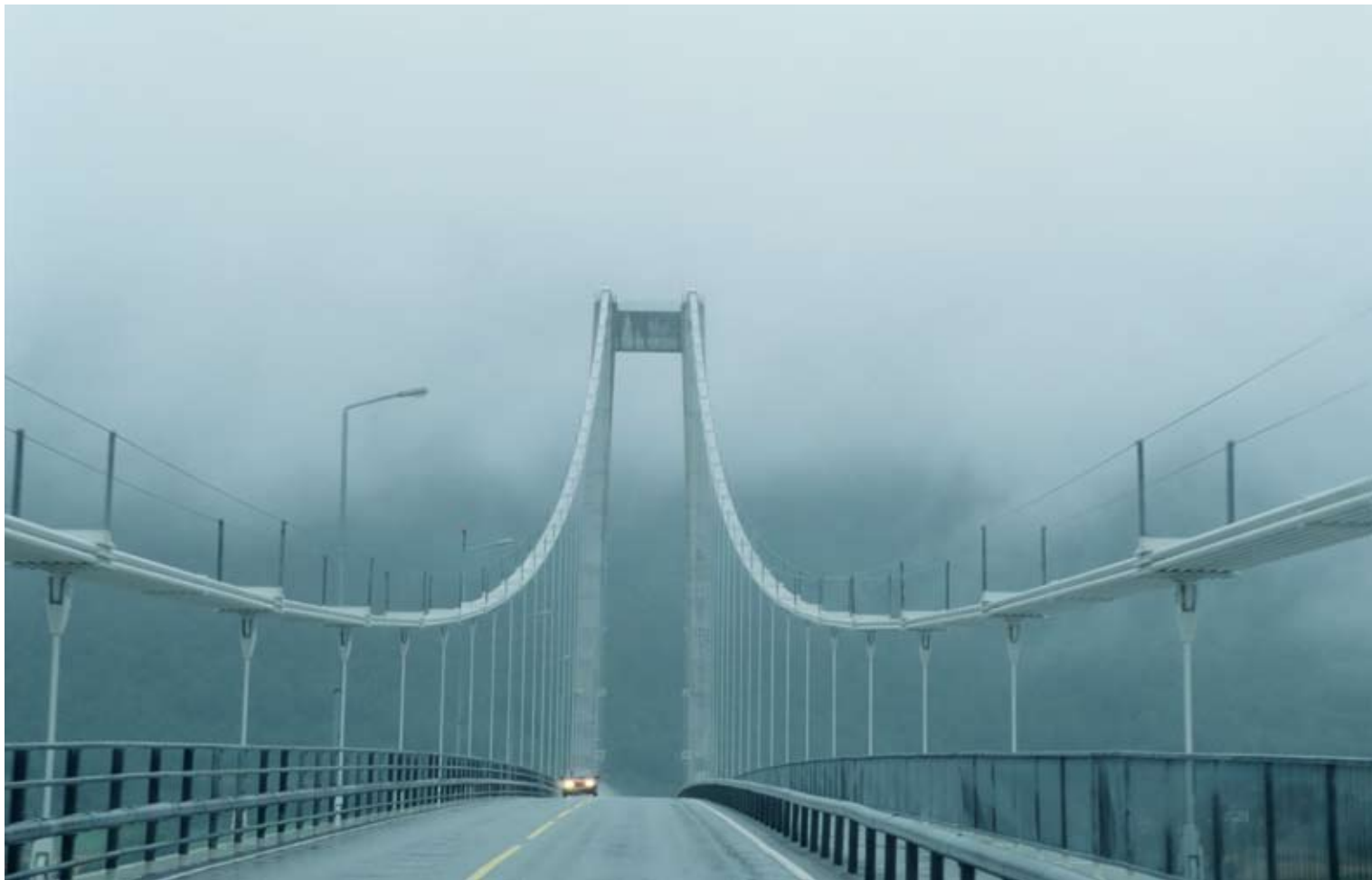
"Krifast i gråvær" av Bjarne Nygård, Molde Kameraklubb