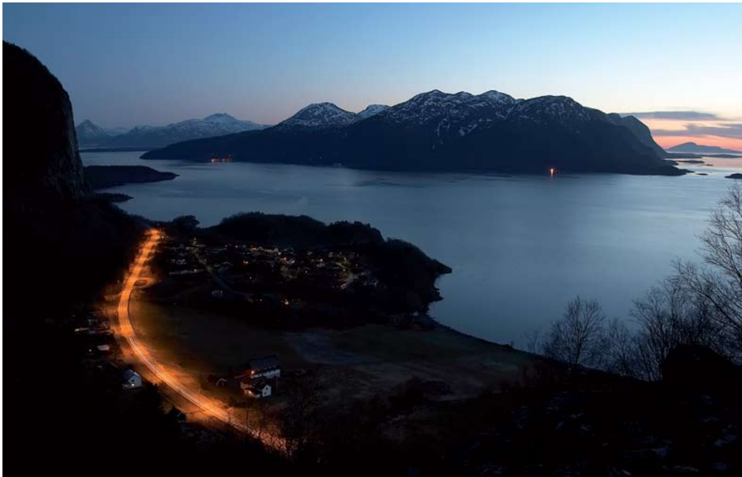
"Eidskrem og Otrøya" av Bjørn Ivar Haugen, Molde Kameraklubb