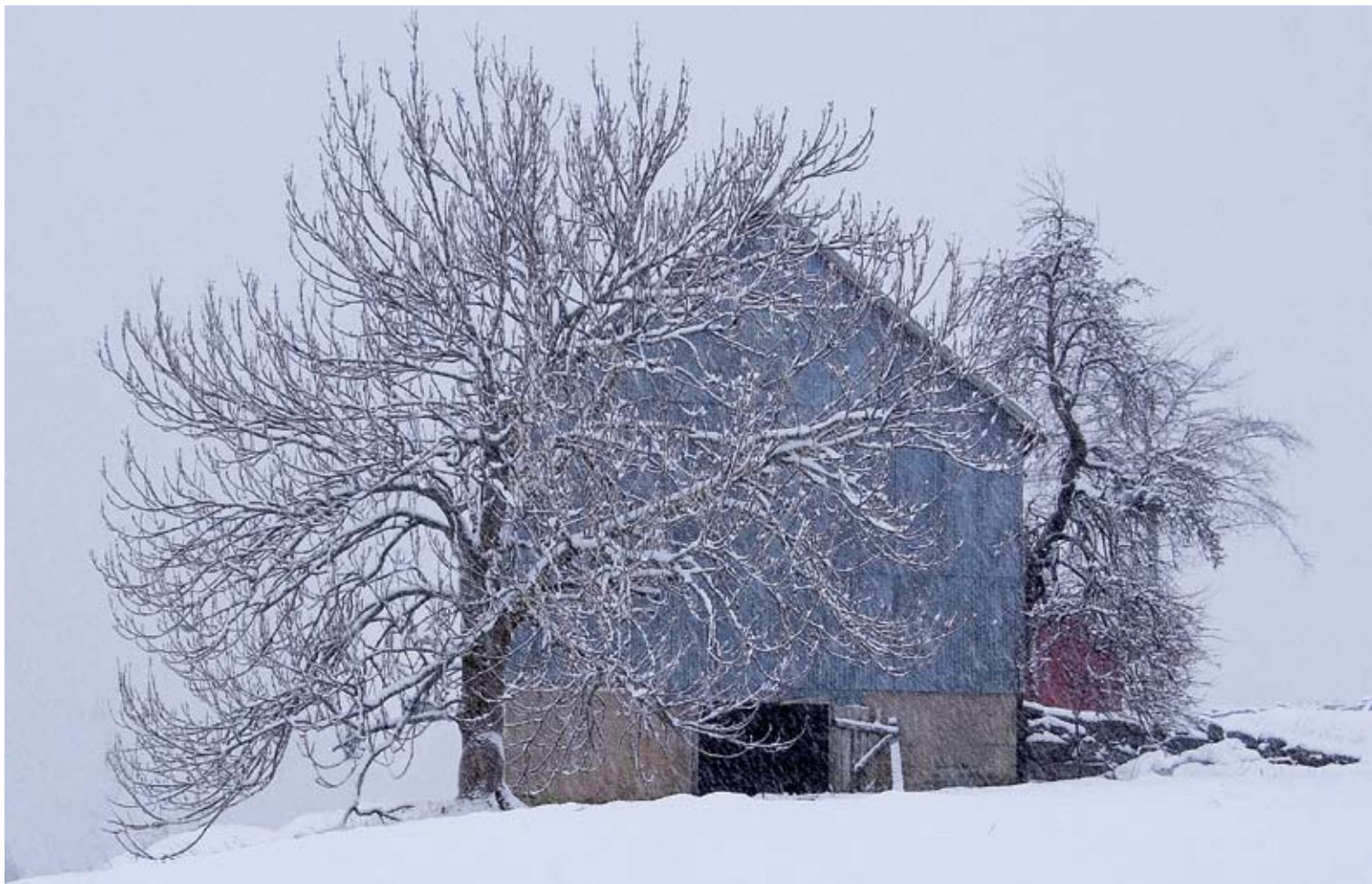
"Vinter ved Fannefjorden" Tatt ved Nakken Gård av Tore Egeberg, Molde Kameraklubb