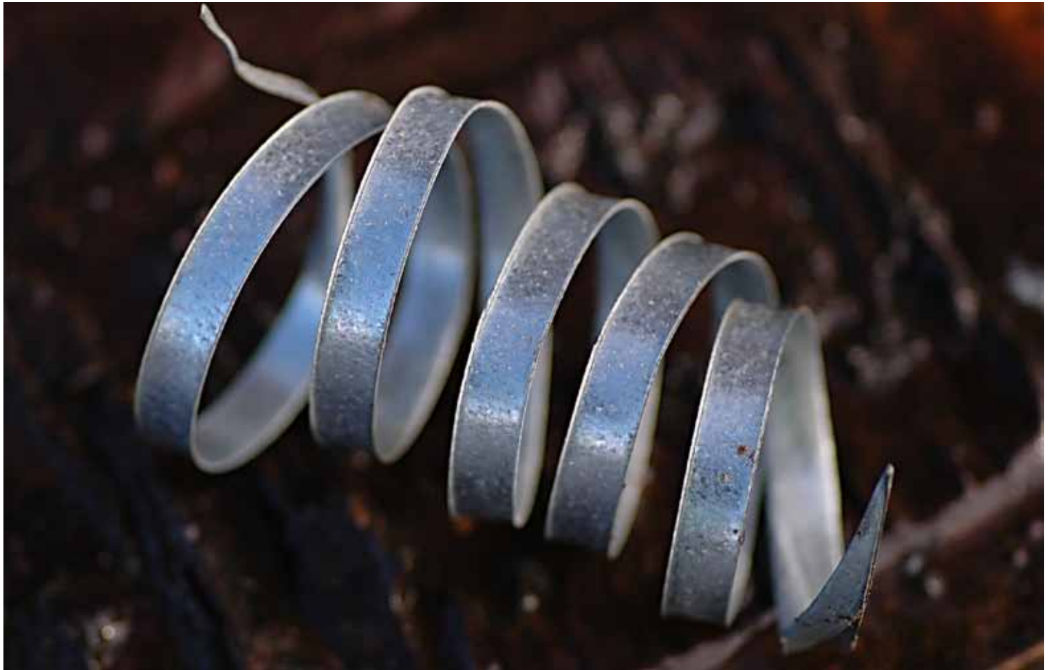
"Spiral" av Liz Gunn, Molde Kameraklubb