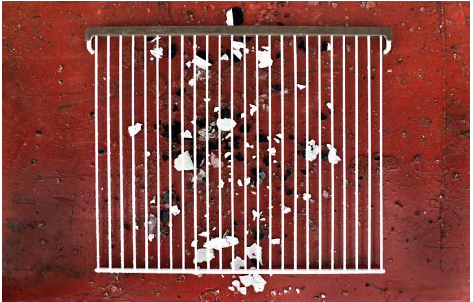
"Kasserollerist" av Leif Erling Aasan, Molde Kameraklubb