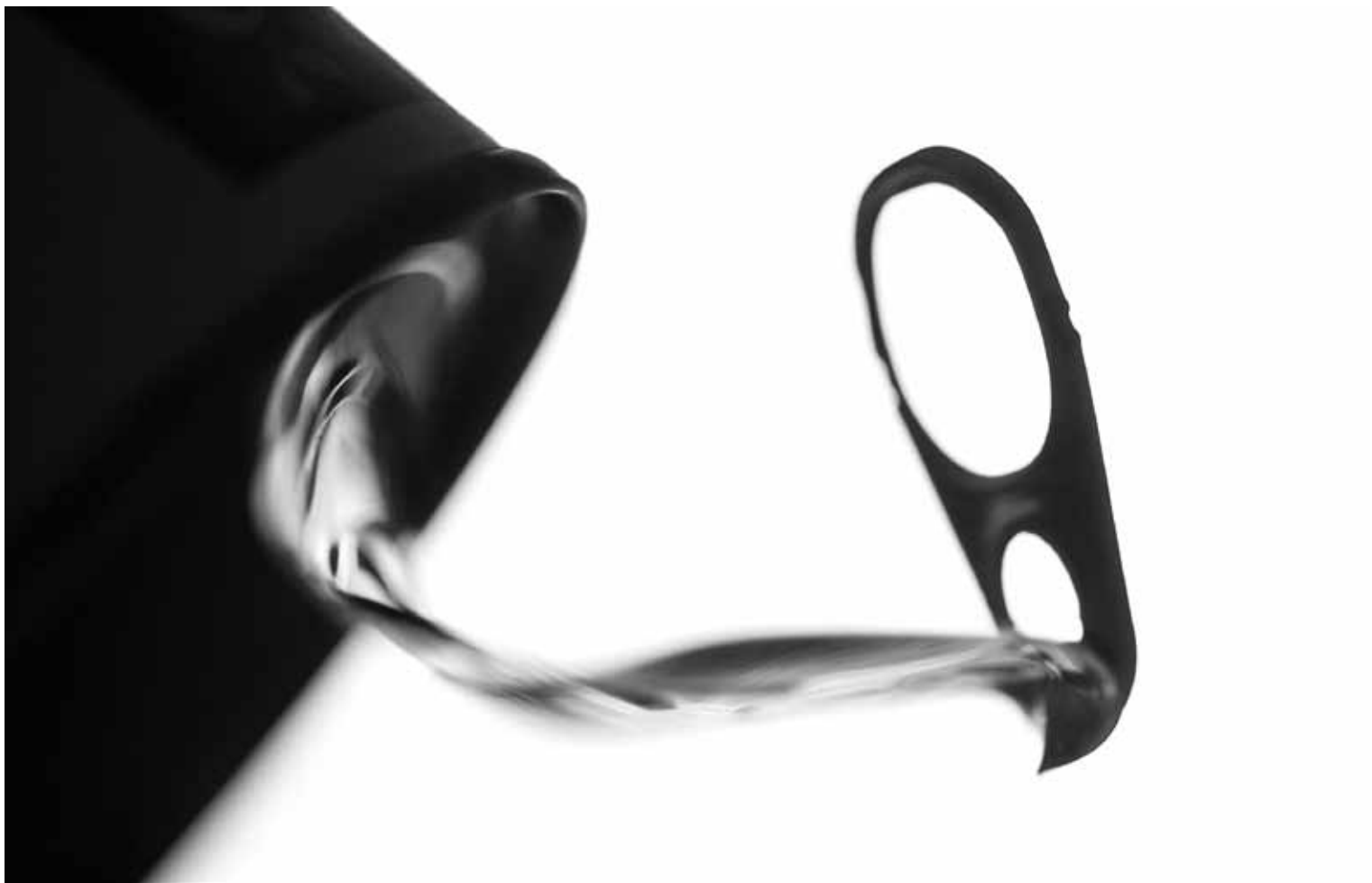
"Boks" av Jonas Hallberg Eggen, Molde Kameraklubb