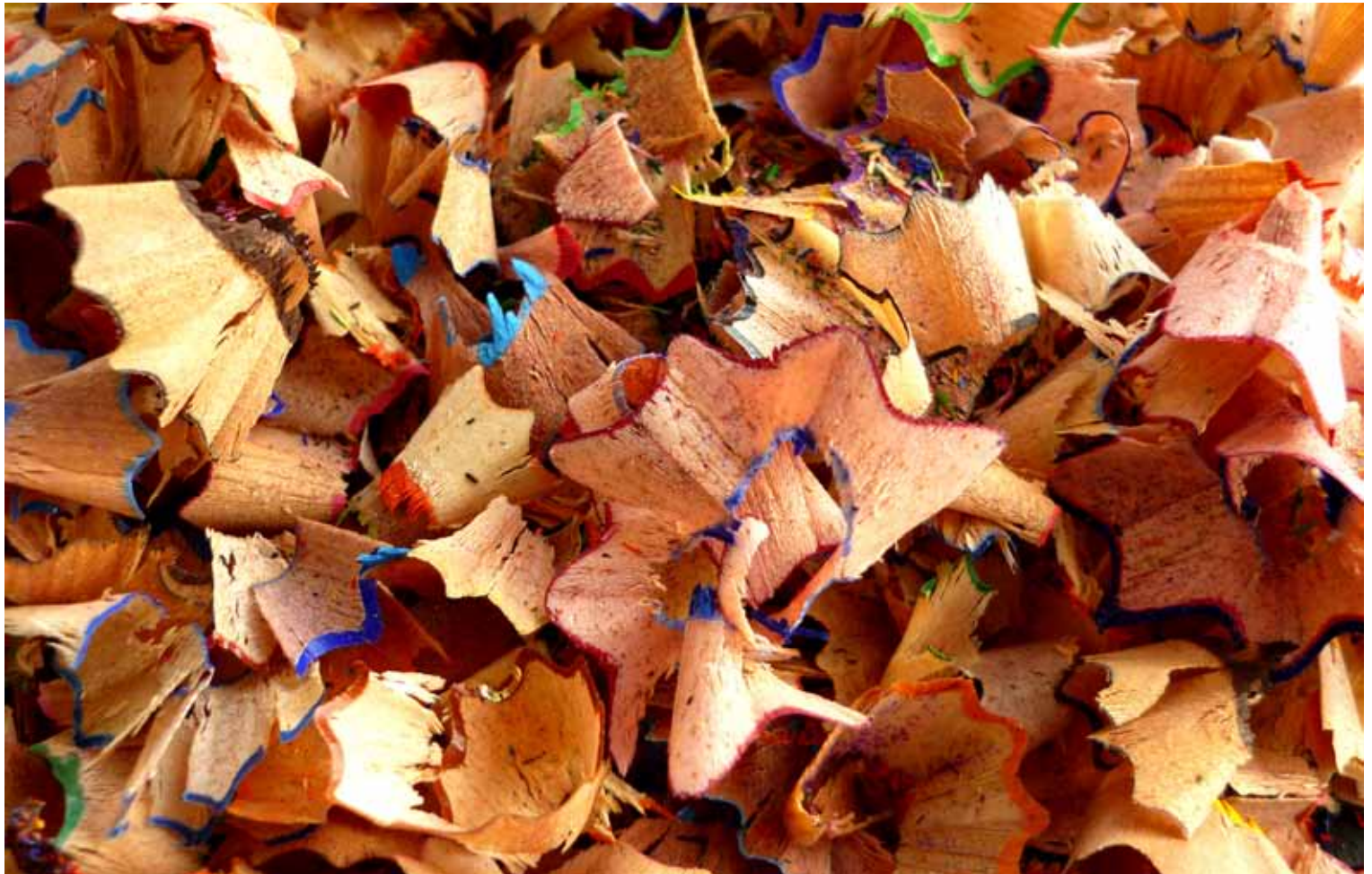
"Fargekunst" av Marit Sporheim, Molde Kameraklubb