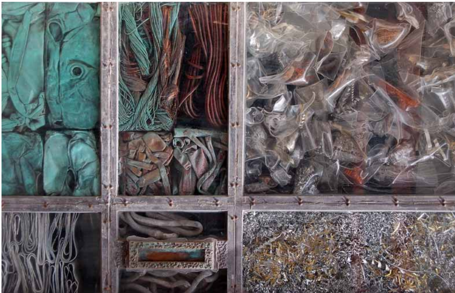
"Brevsprekk" av Svein Kvakland, Molde Kameraklubb