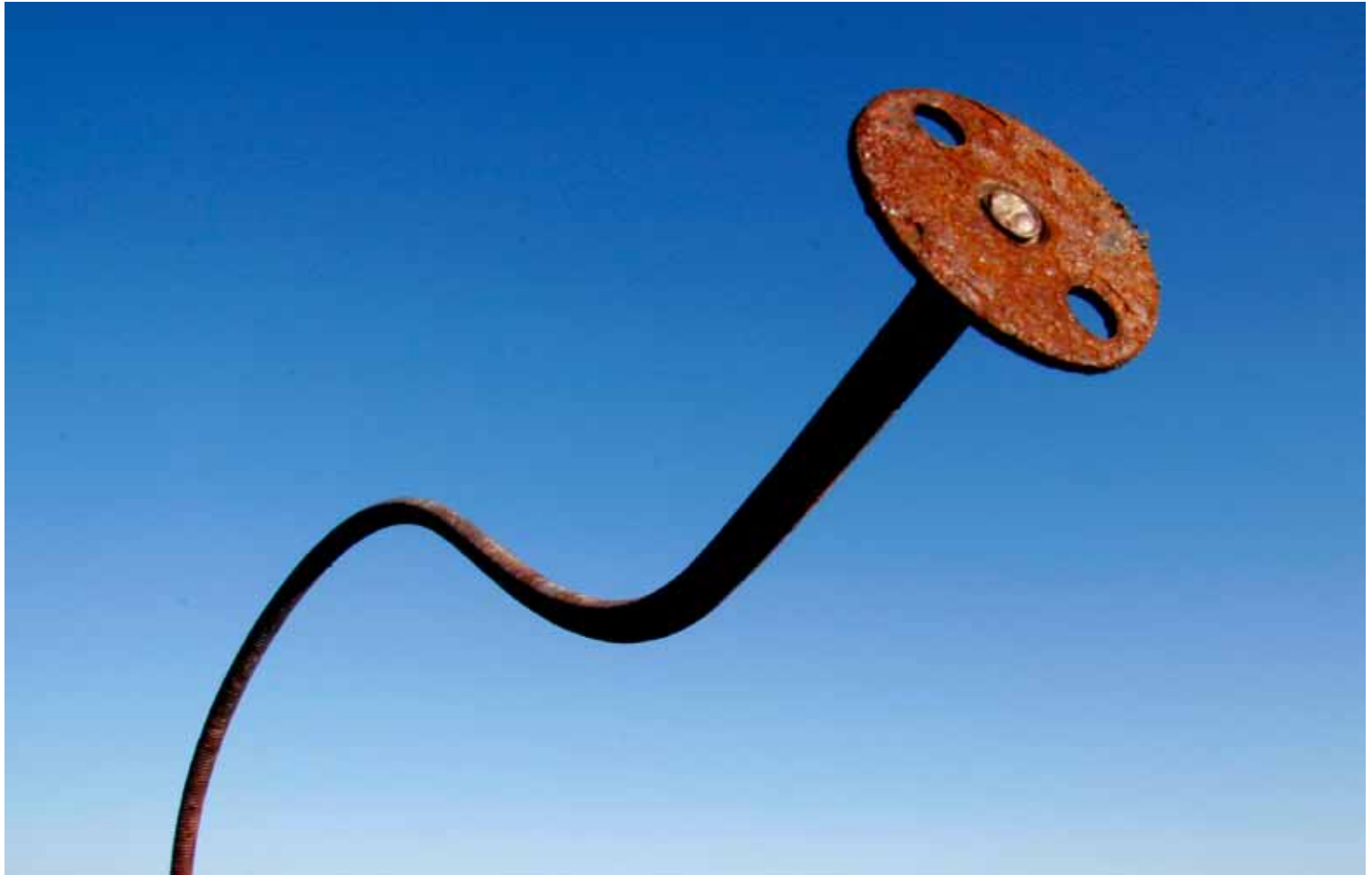
"Still standing" av Bjarne Nygård, Molde Kameraklubb