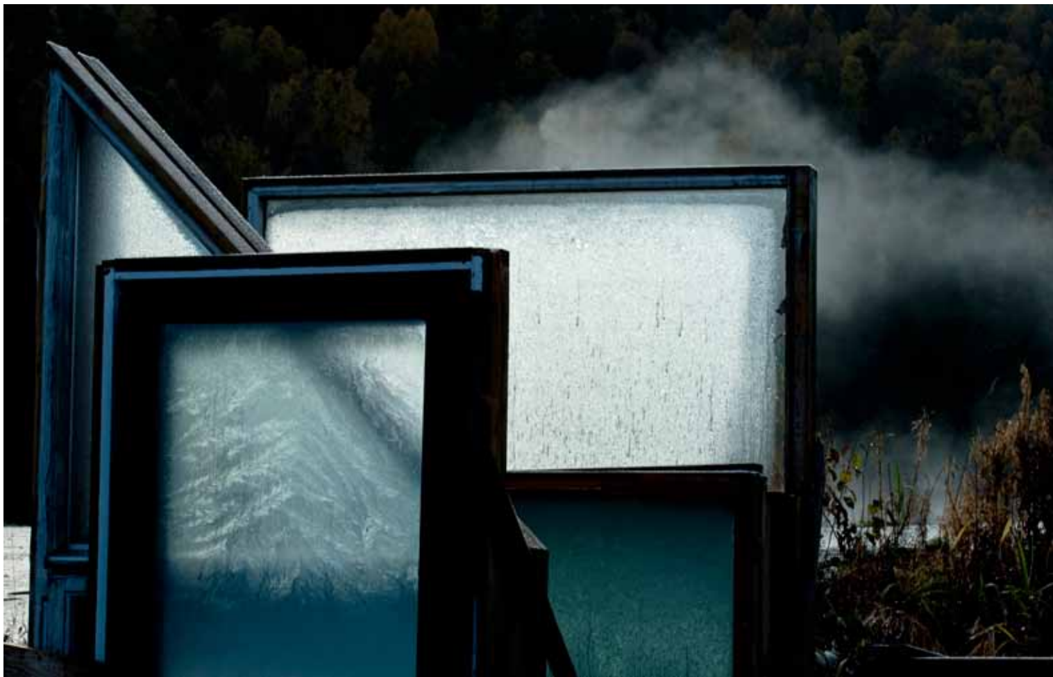
"Husløse vinduer på RIR" av Belinda Dragset, Molde Kameraklubb