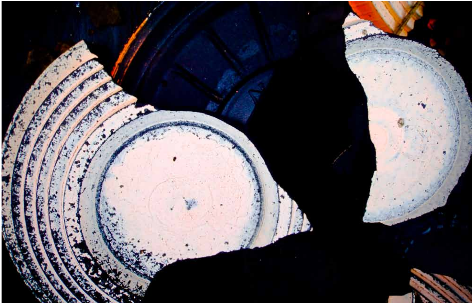
"Lerduer" av Per Stavnesli, Molde Kameraklubb