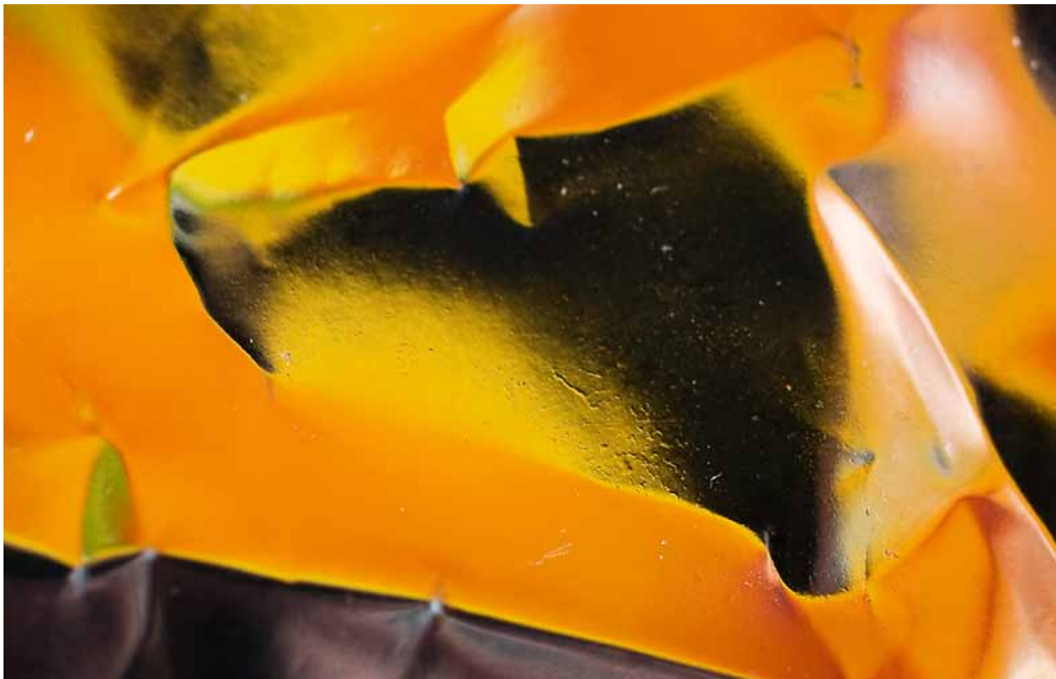
"Aluminiumsfolie" av Jonas Hallberg Eggen, Molde Kameraklubb