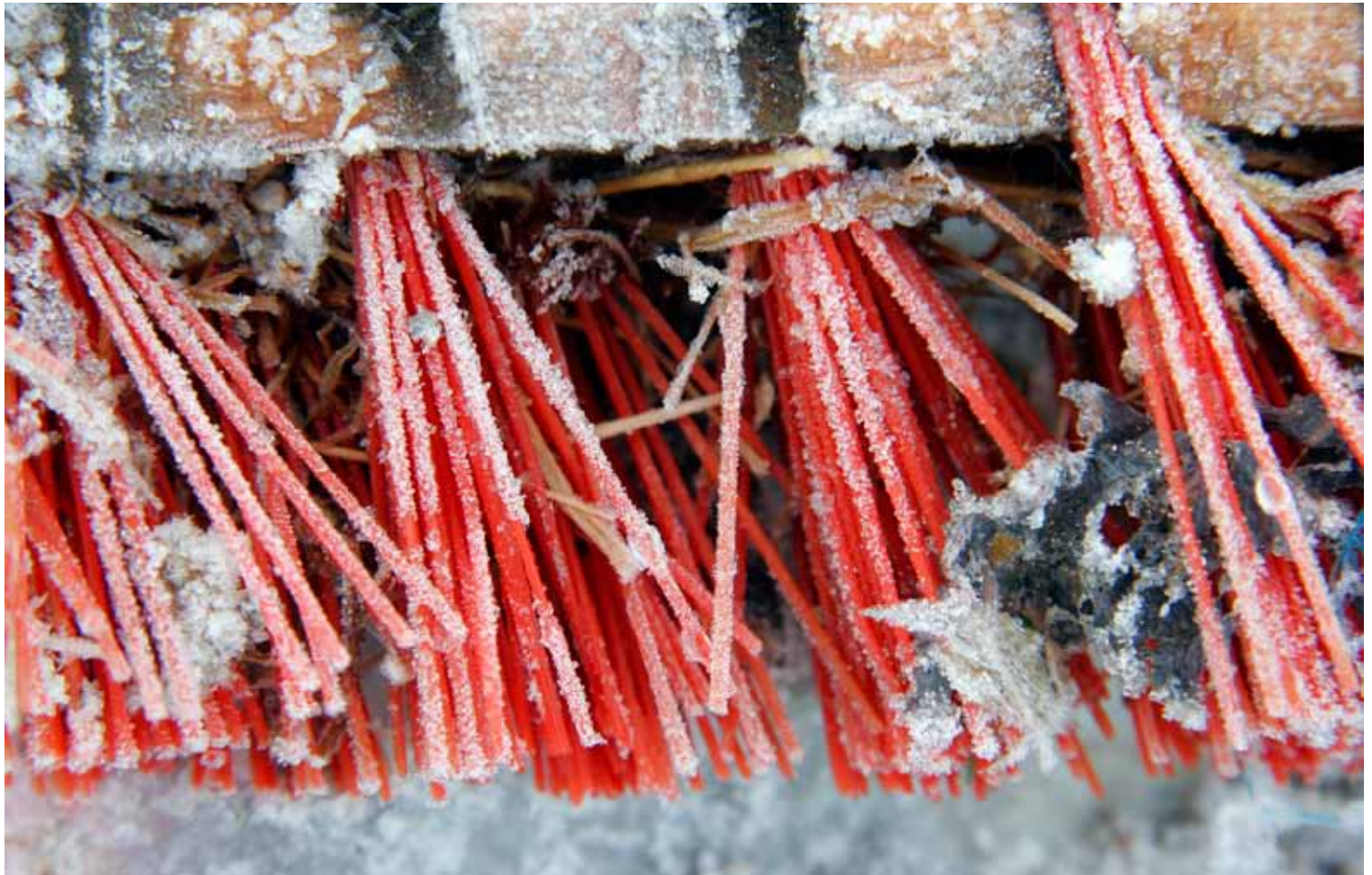
"Sliten tjener" av Bjarne Nygård, Molde Kameraklubb