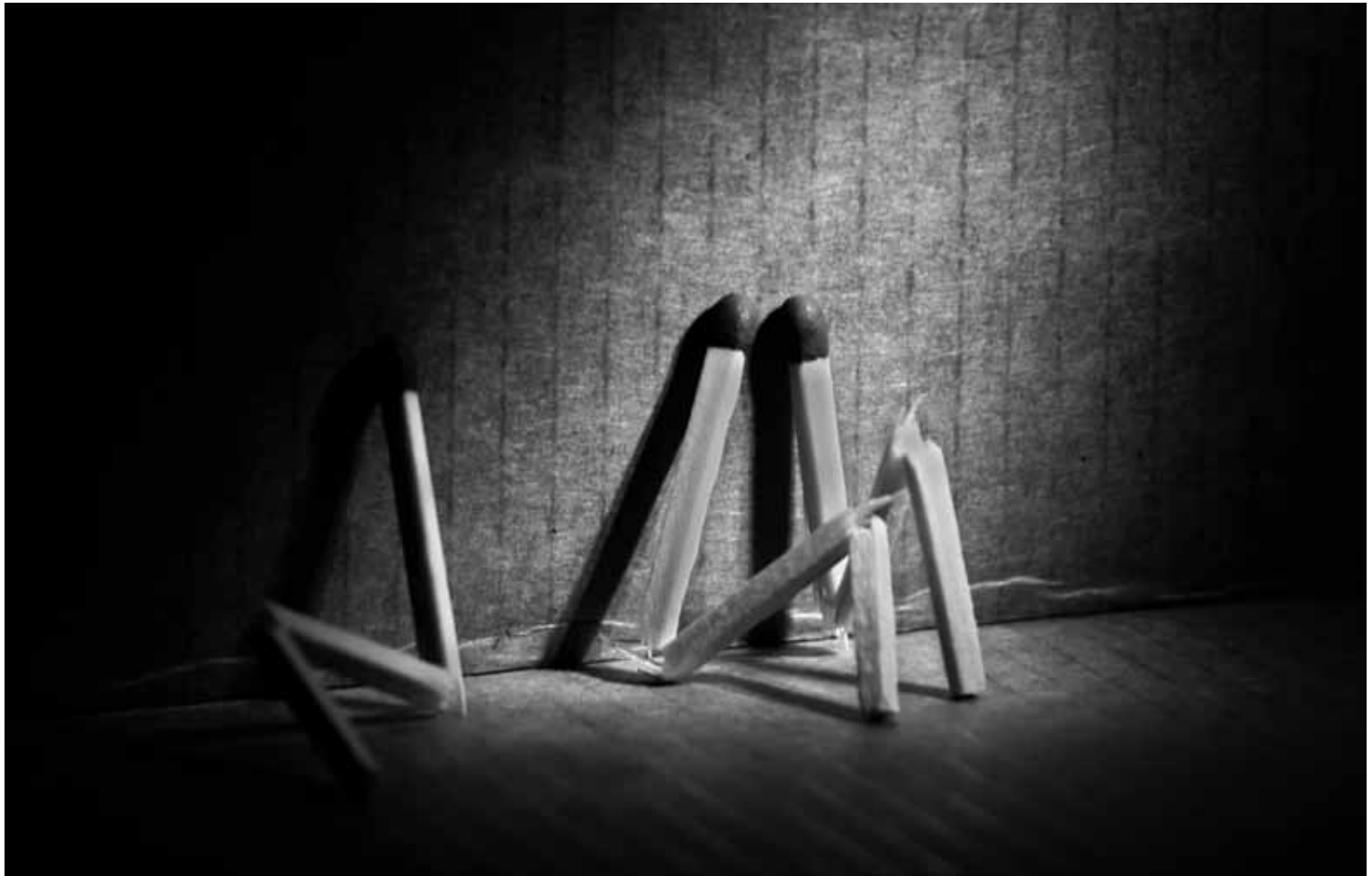
"Talk to me" av Vladimir Kovalenko, Molde Kameraklubb