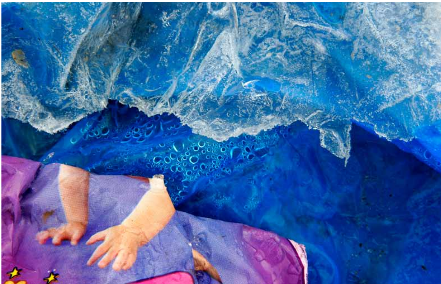
"Standhaftig" av Bjarne Nygård, Molde Kameraklubb